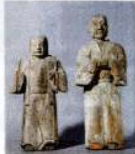
伊豆我十郎・伝虎御前の木像 (市指定文化財)