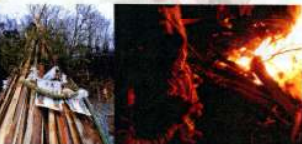
畚沢のオコヤとどんど焼き