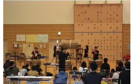
卒業生と3年生による「夜叉神太鼓」