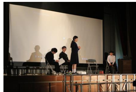
劇「ちょっとだけメロス」