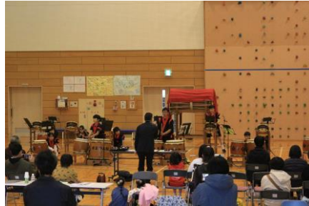
小中合同和太鼓演奏「勇気」