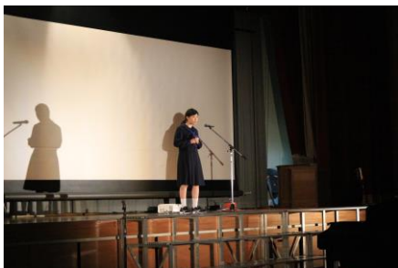
イングリッシュスピーチ