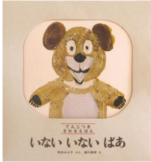
『てんじつきさわるえほん いないないばあ』 松谷みよ子/ぶん 瀬川康男/え 童心社 2021年

てんじ ゆび よ も じ 点字（指でさわって読む文字）つ え ほん え りんかく も じょう き の 絵 本 だ す。 絵 も 輪 郭 や 模 様 な ど も あ いんさつ を 盛 り 上 げ て 印 刷 し、 さ わ っ て わ か く ふう る よ う に、 工 夫 さ れ て い ま す。 め み ひ と み ひ と いっしょ 目 が 見 え る 人 も 見 え な い 人 も 一 緒 たの に 楽 し む こ と が で き ま す。