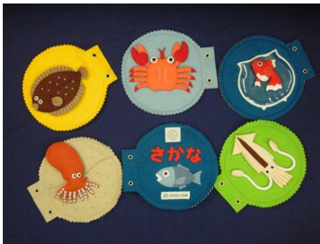
『さかな』 ふきのとう文庫制作

布でできた絵本です。絵や文字が アップリケなどで作られ、さわって 物の形を確かめることができます。 スナップ、マジックテープ、ファス ナーなどで、くっつけたり、はずし たり、ボタンをはめたり、いろいろ なしかけがついています。