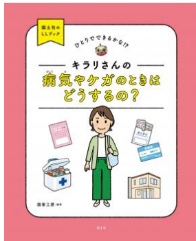
『キラリさんの 病気やケガのときはどうするの?』 読書工房/編・著 国土社 2022年

やさしい言葉でわかりやすく書か れた本です。短くてやさしい文章 と、絵、写真、ピクトグラム (絵 記号) を組み合わせて作られ、漢字 にはふりがな (ルビ) がふってあり ます。