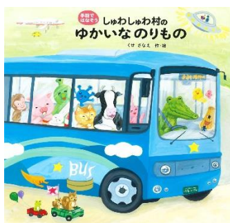
『しゅわしゅわ村のゆかいなりのもの』 くせさなえ/作・絵 偕成社 2018年